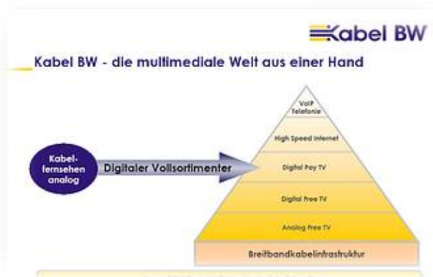
Bild 4.2: Anwendungspalette von Digital-Kabel-TV am Beispiel Kabel-BW

Ergänzend dazu benötigt man i.d.R. noch eine handelsübliche Ethernet-Netzwerkkarte für die Verbindung zwischen dem Computer und dem Kabelmodem oder der Set-Top-Box. Im Vergleich zu einem Internetzugang via Telefonnetz hat das TV-Kabelnetz den Vorteil, dass TV-Kabel Standleitungen sind. Der Zugang wäre somit zeitlich unbegrenzt. Kabelmodem oder Set-Top-Box verbinden den Computer nach dem Einschalten mit dem Internet, und die Verbindung ist stetig aktiv.